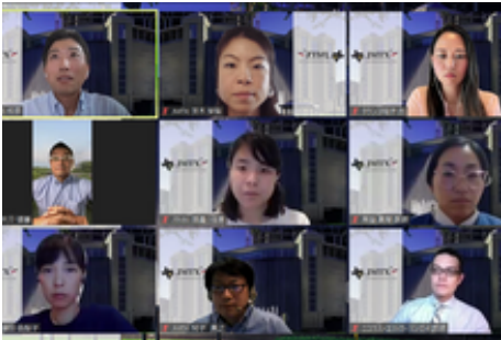
第4回ウェビナーの様子

2024年は第3~第5回（第5回は商工会との共催）のウェビナーを開催することができました。JMTXメンバーや、アメリカ各地の医療者の方々に登壇に協力して頂きました。どの回も積極的に多くの質問が寄せられ、皆様の関心の高さが伺えました。JMTXでは今後も引き続き皆様のお役にたつ医療情報を提供して参りたいと思います。